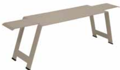
1015 - BANK Bank Stahlblech 8 mm