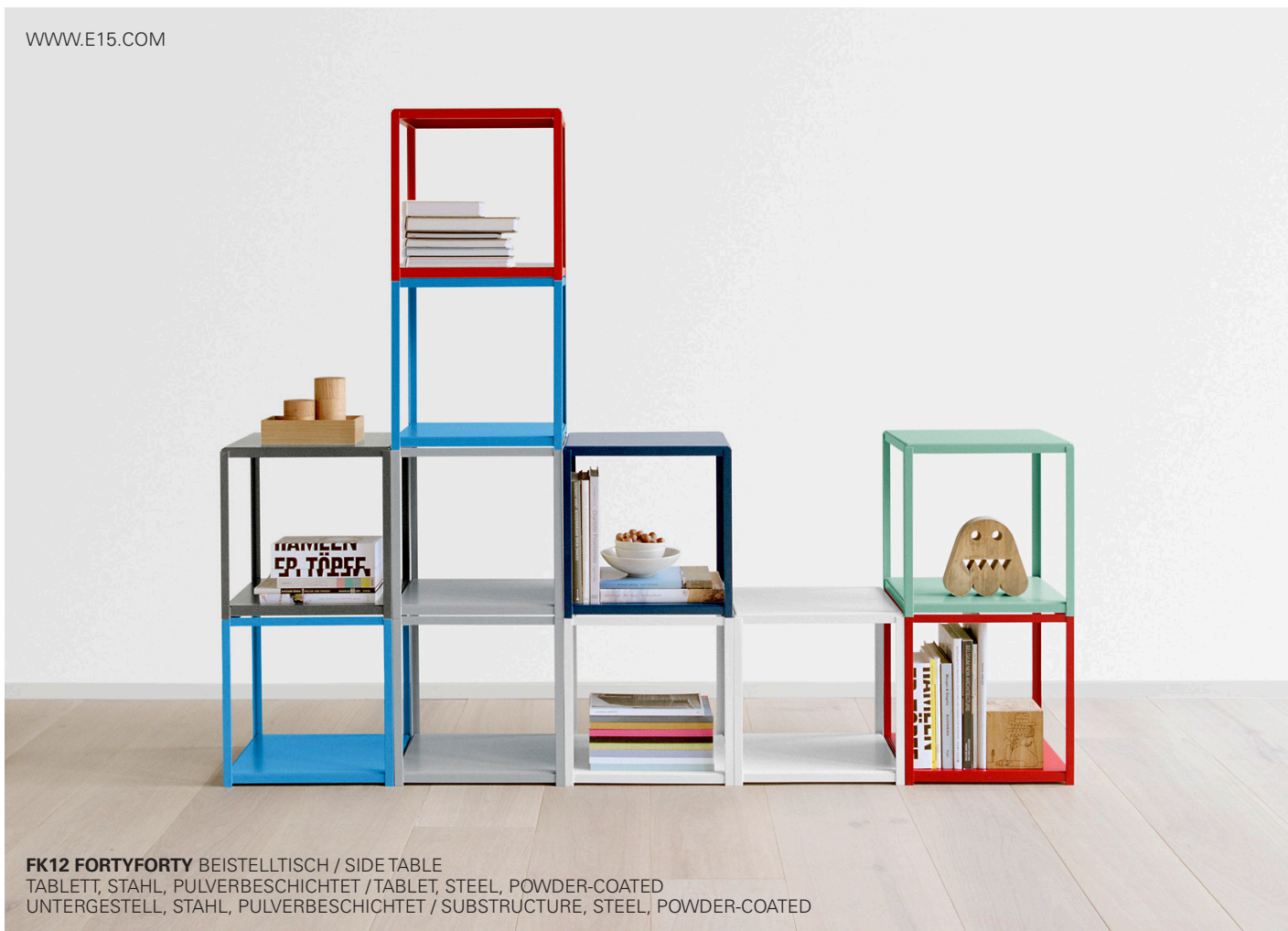
FK12 FORTYFORTY BEISTELLTISCH / SIDE TABLE TABLETT, STAHL, PULVERBESCHICHTET / TABLET, STEEL, POWDER-COATED UNTERGESTELL, STAHL, PULVERBESCHICHTET / SUBSTRUCTURE, STEEL, POWDER-COATED