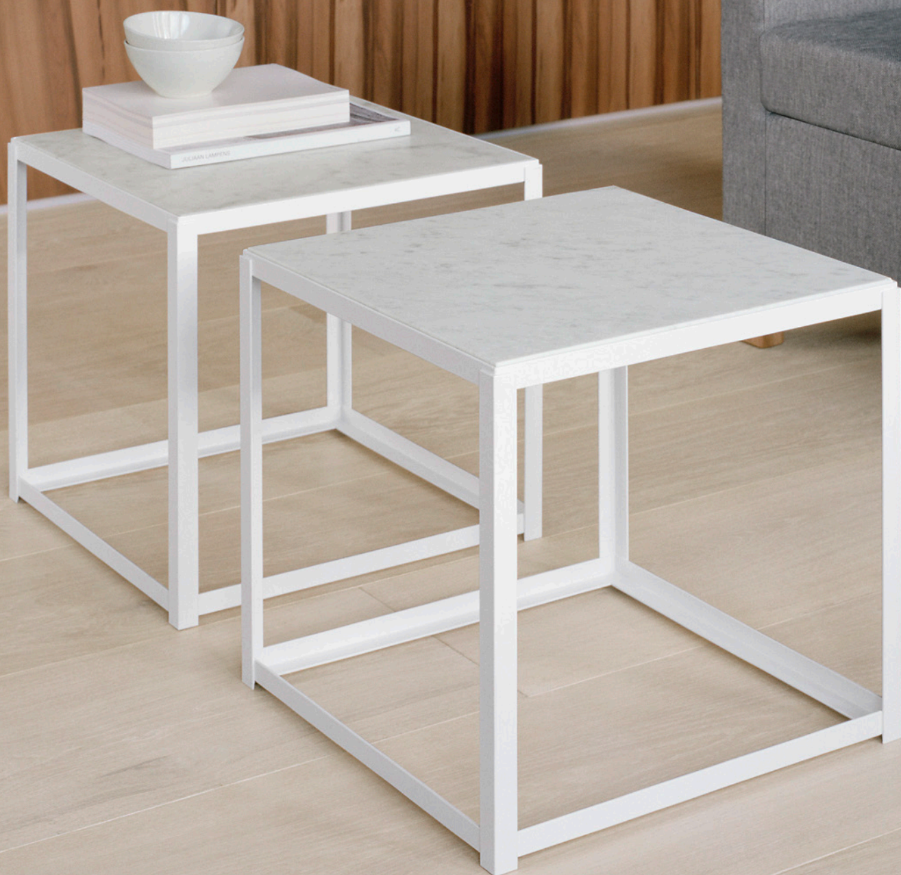
FK12 FORTYFORTY BEISTELLTISCH / SIDE TABLE MARMORPLATTE, GEÖLT / MARBLE TABLE TOP, OILED UNTERGESTELL, STAHL, PULVERBESCHICHTET / SUBSTRUCTURE, STEEL, POWDER-COATED FK10 WEISSENHOF SESSEL / LOUNGE CHAIR