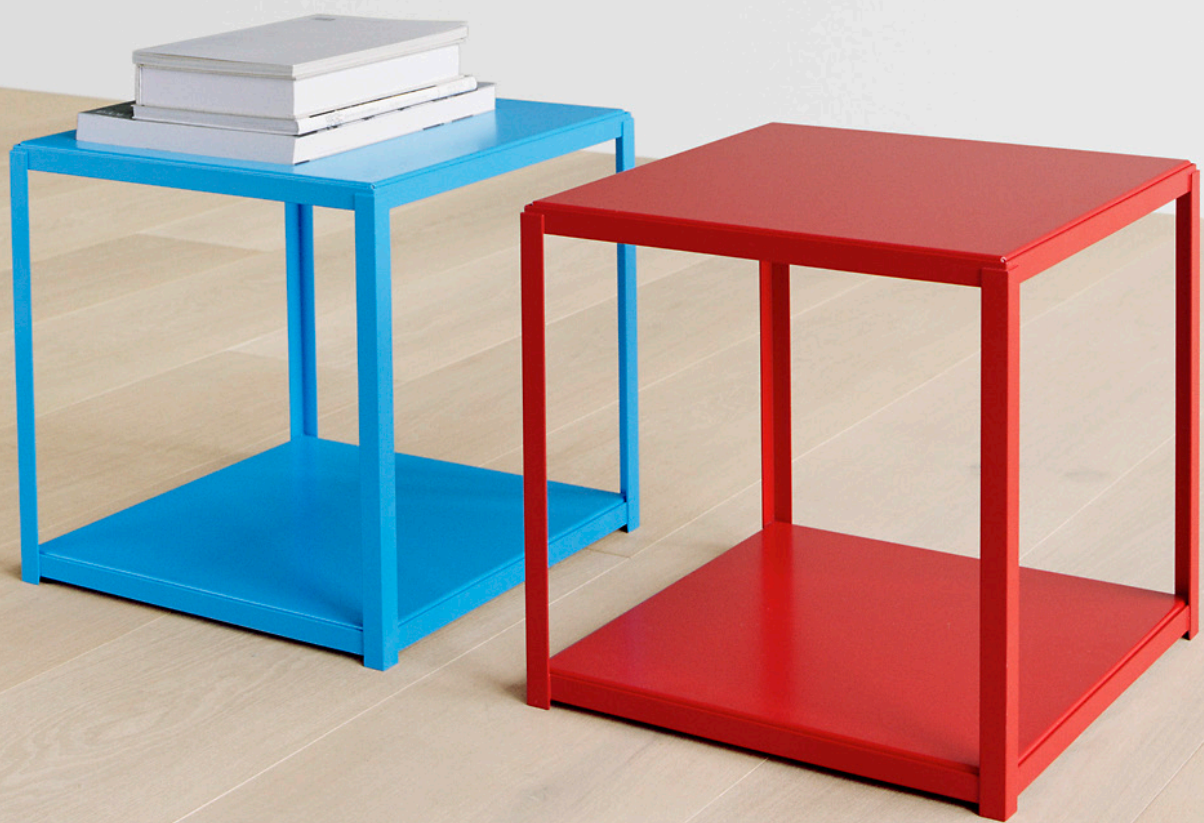
FK12 FORTYFORTY BEISTELLTISCH / SIDE TABLE TABLETT, STAHL, PULVERBESCHICHTET / TABLET, STEEL, POWDER-COATED UNTERGESTELL, STAHL, PULVERBESCHICHTET / SUBSTRUCTURE, STEEL, POWDER-COATED