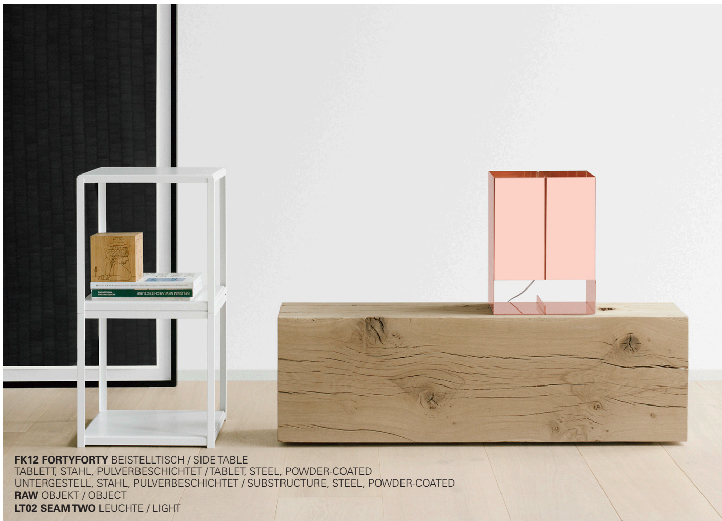
FK12 FORTYFORTY BEISTELLTISCH / SIDE TABLE TABLETT, STAHL, PULVERBESCHICHTET / TABLET, STEEL, POWDER-COATED UNTERGESTELL, STAHL, PULVERBESCHICHTET / SUBSTRUCTURE, STEEL, POWDER-COATED RAW OBJEKT / OBJECT LT02 SEAM TWO LEUCHE / LIGHT