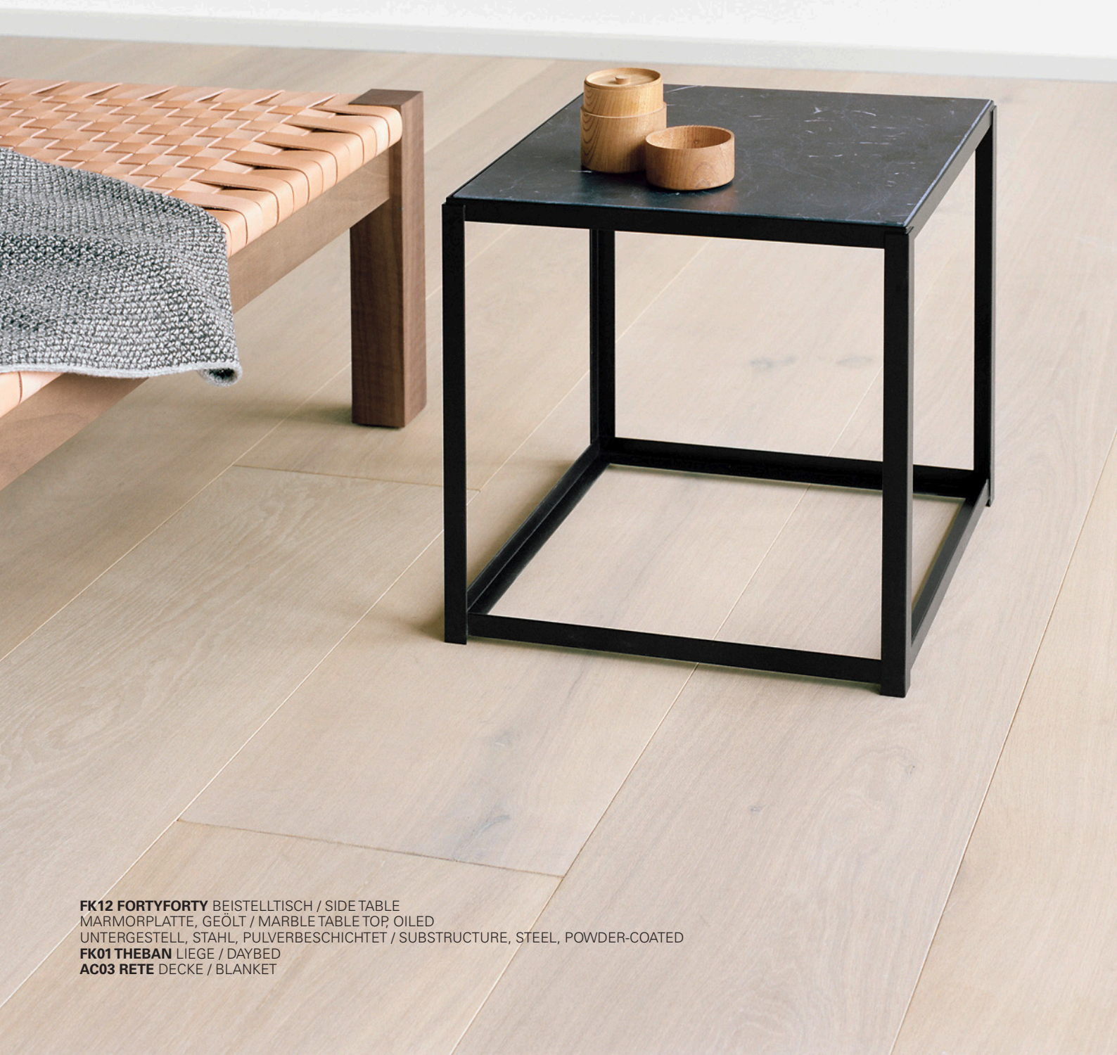
FK12 FORTYFORTY BEISTELLTISCH / SIDE TABLE MARMORPLATTE, GEÖLT / MARBLE TABLE TOP, OILED UNTERGESTELL, STAHL, PULVERBESCHICHTET / SUBSTRUCTURE, STEEL, POWDER-COATED FK01 THEBAN LIEGE / DAYBED AC03 RETE DECKE / BLANKET