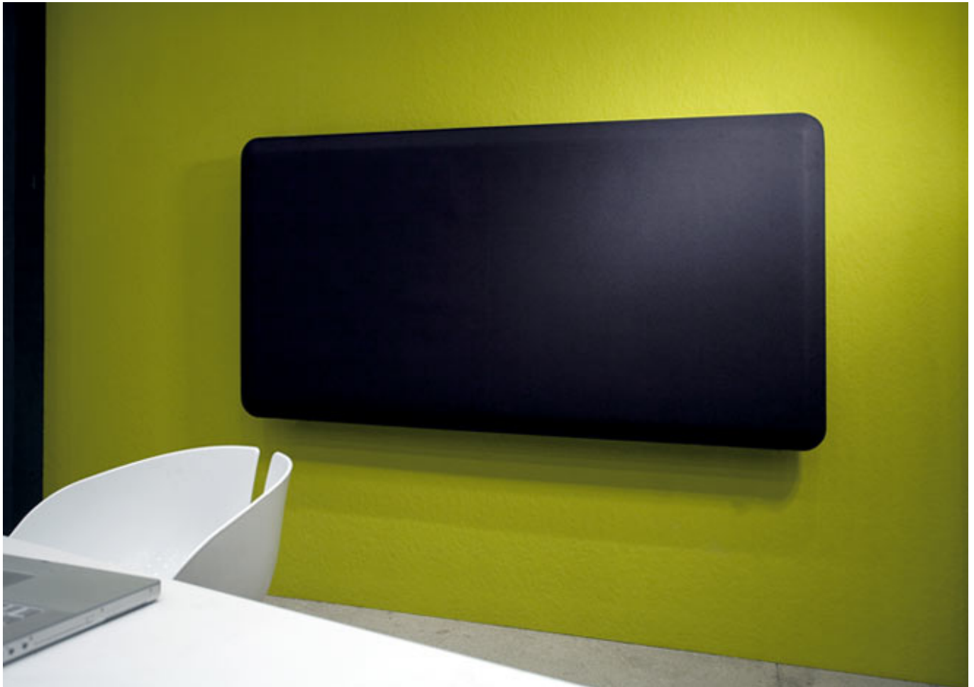
Pannello murale quer